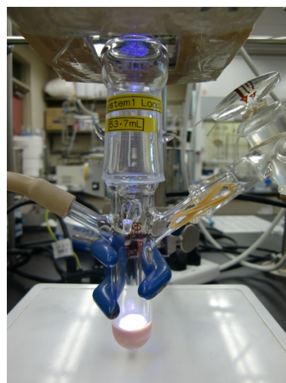
図 1 光反応の様子

⑧ 得られた反応溶液の色を観察する。またその溶液の紫外一可視分光測定を行う。反応前の溶液と比較し、どの程度色素が分解されたかを考察する。