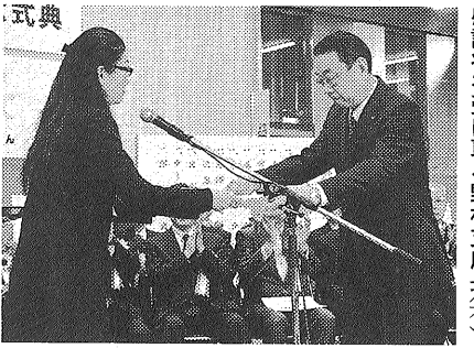
感謝状を受け取る野村支店長（右）