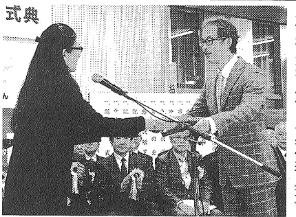
感謝状を受け取る小泉代表（右）

式典の冒頭、林文字子市長は区民の理解・支援、建設など事業者の尽力に感謝し、免震構造の採用や自然エネルギーの有効活用、木材利用などによる施設の特徴を説明した。また、区民に分かりやすく、親しみのある区総合庁舎として、おもてなしの心にあふれたサービスを提供していきたい」と述べ、引き続き公会堂の整備を進めるなど、区民との信頼関係を発展させてい